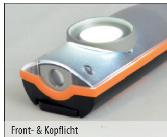
Front- & Kopflicht