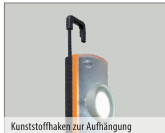
Kunststoffhaken zur Aufhängung